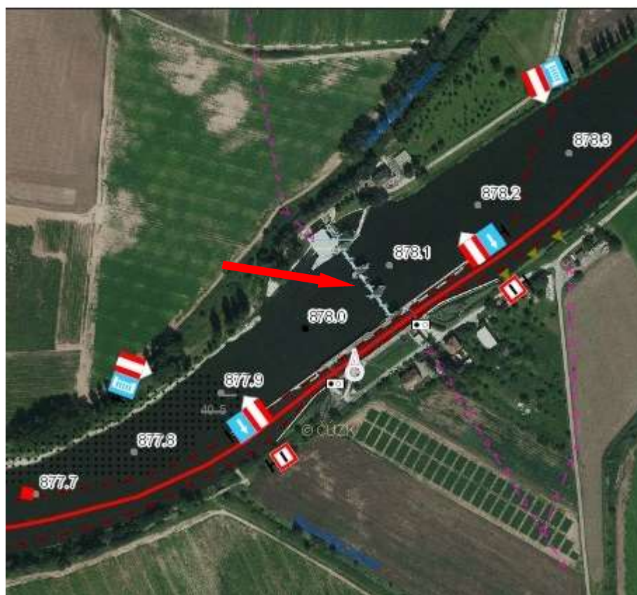
C.3. Celkový situační výkres stavby (plavební mapa)